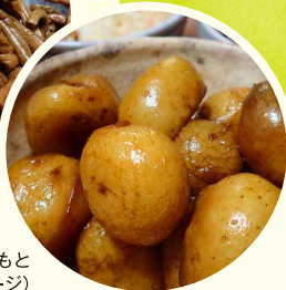
郷土料理のころいもと ゼンマイ(イメージ)